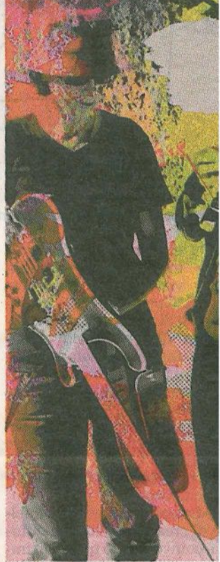
Accanto The Breeders oggi in città Sotto il cortile del Castello

» Oggi dalle 21 nel cortile del Castello si esibiscono i The Breeders band cult anni Novanta